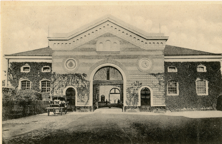
Vnitřek knížecích stájí.