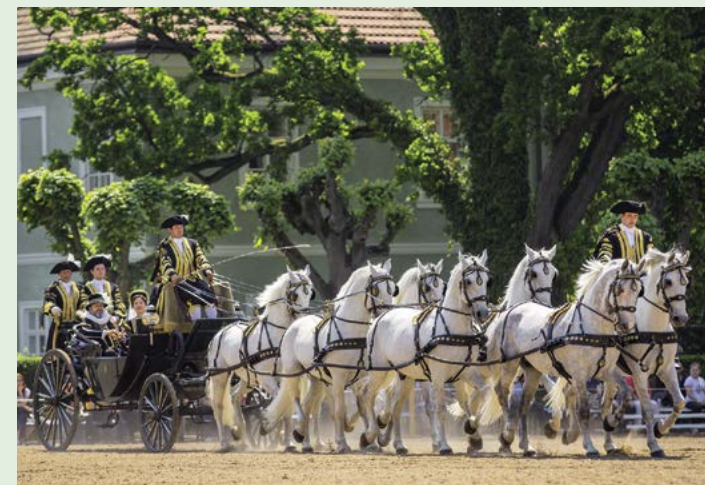
Den starokladrubského koně