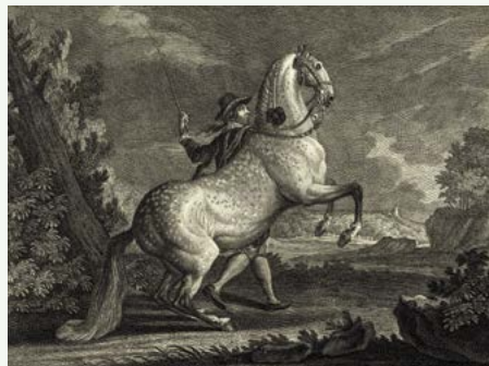
Johann Elias Ridinger, kůň španělský

Starokladrubský kůň je nejstarší české plemeno koní, šlechtěné jako kočárové pro ceremoniální účely královských a císařských dvorů. Impozantním vzhledem a typickým vysokým chodem v klusu nemá ve světě obdoby. Jeho chov sahá do počátků 16. století a je neodmyslitelně spjat s hřebčínem v Kladruzech nad Labem. Má španělsko-italské předky z Pyrenejského