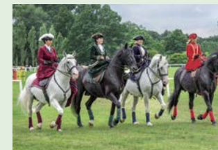
Jeздеcký den, Kladruhy nad Labem