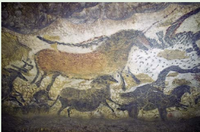
Jeskynní malba v Lascaux, 20–30 tisíc let př. n. l.