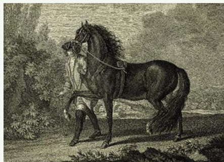
Johann Elias Ridinger, kůň italský

a Apeninského poloostrova, kde chovatelé využívali k zušlechtění tamní populace arabské koně. Výslednými produkty byli mimořádně ušlechtilí jedinci, harmoničtí, se vznosným pohybem a častým klabnosem. Chováni byli ve všech barevných variantách, teprve od konce 18. století se ustalovalo bílé a vrané (černé) zbarvení, které je dnes žádoucím plemenným znakem.