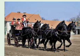
Den starokladrubského koně