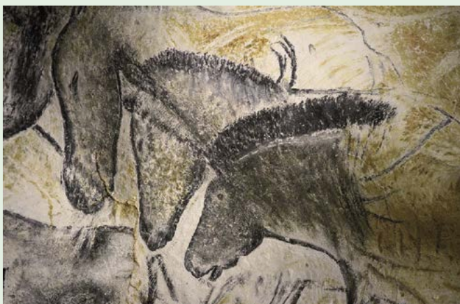
Jeskynní malba v Chauvetově jeskyni, 30 tisíc let př. n. l.