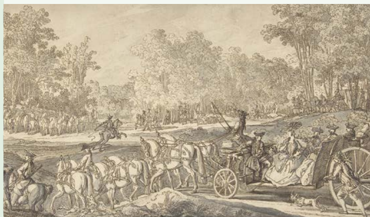
Johann Elias Ridinger, ceremoniální zápřež